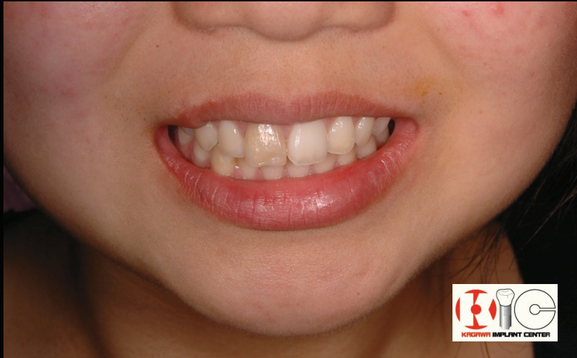
Before & After