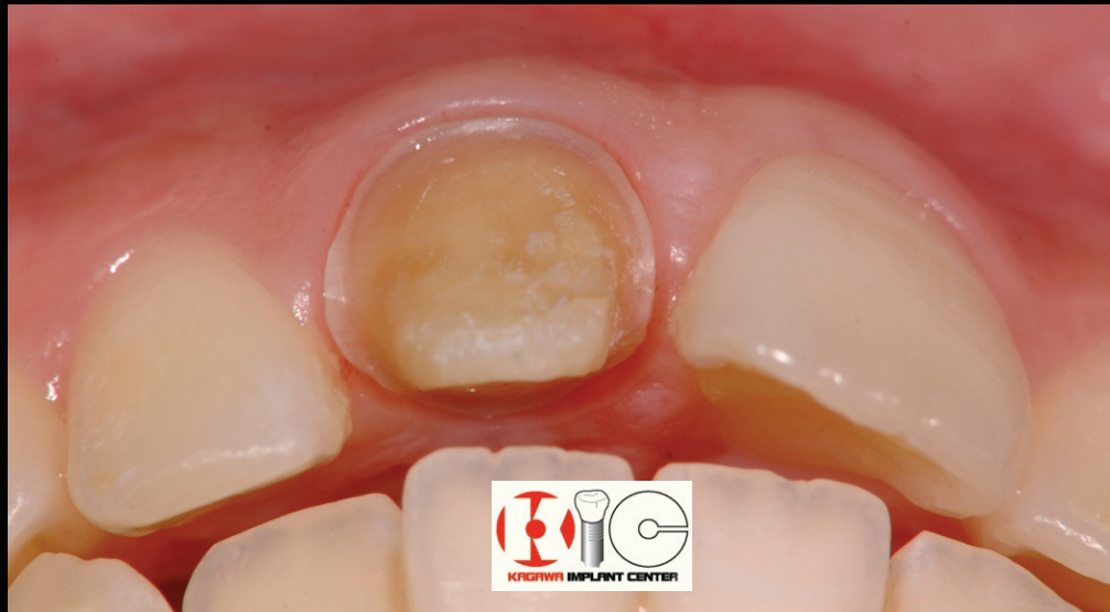
Before & After