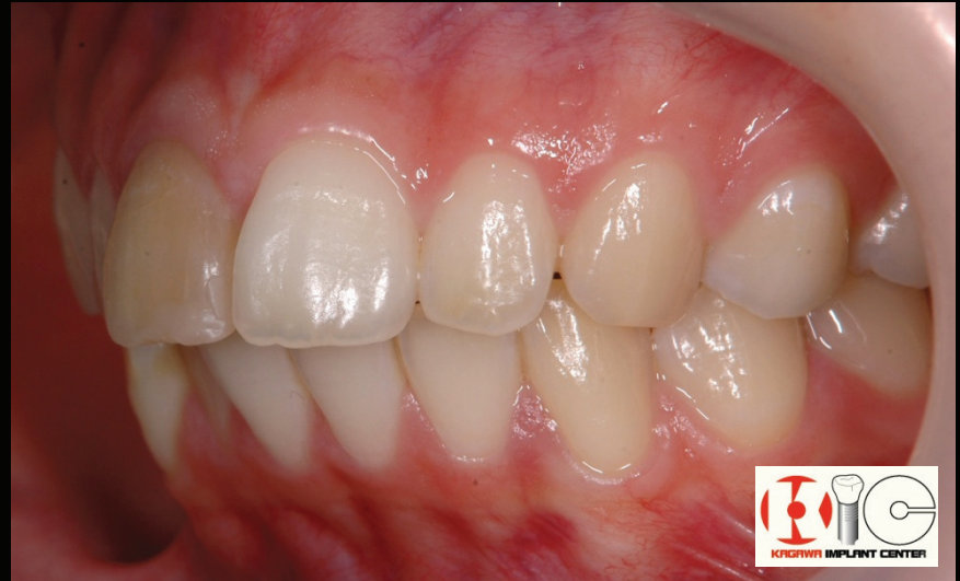
Before & After