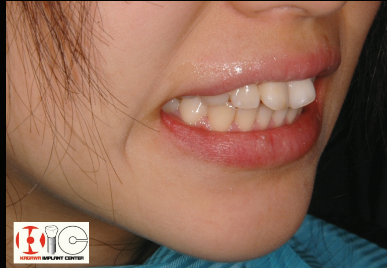
Before & After